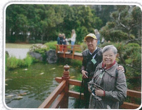
張太最懷念活動中心安排的戶外旅遊

「我十分感謝澳華療養院基金上下員工，給予我們無微不至的照顧和保護。在這期間我深深體會雖然新冠病毒無情，但頤康苑內卻人間有情！我深信在這裡與所有人一起同心抗疫，一定會看見曙光！」