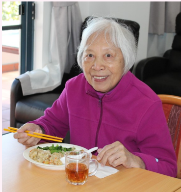
好思維長者活動中心