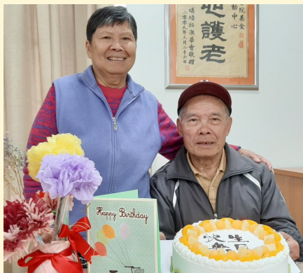
蘇懷長者活動中心