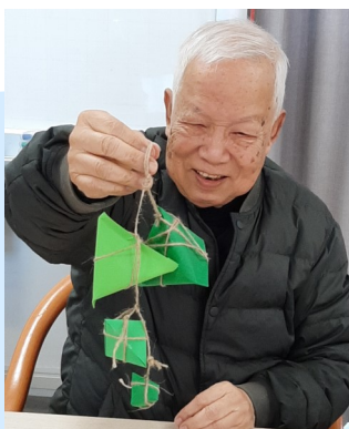
金匙長者康頤天地