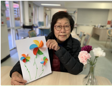
沛德長者活動中心