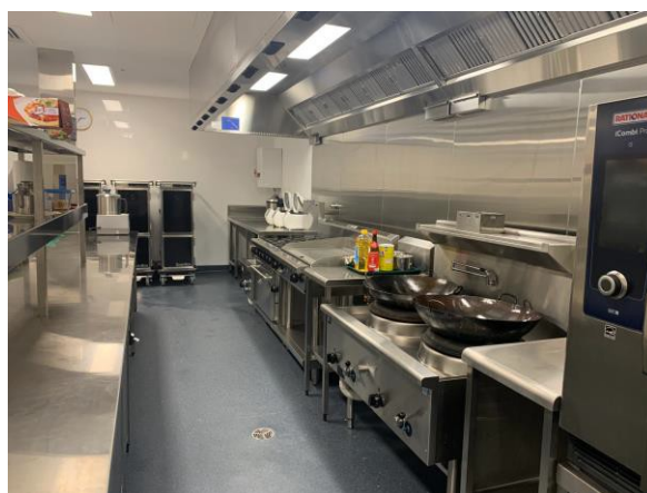
別具文化特色的商用廚房