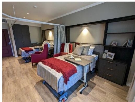
雙人套房（附共用浴間）