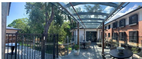
其他特色，例如通往茶室帶有遮蓬的走道