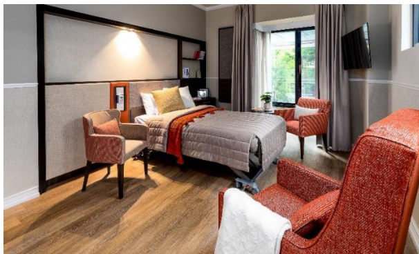
單人套房（附共用浴間）