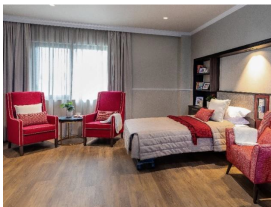
大單人套房-帶獨立浴間 (這是本院唯一的最大的套房)